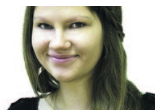
Repliik: Euroremondist Eurovisioonini