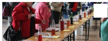
Koduveinikonkursi finalistid valitud