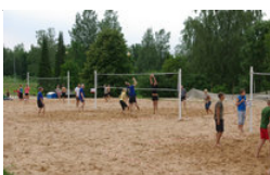
Juhtkiri: Ikka omade poolt