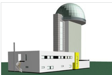
Ministeerium läheb radari rajamisega edasi

►Kaitseministeerium kuulutas eile, 16. mail välja riigihanke, millega soovitakse leida Otepää valda Tõikamäele radarposti ehitajat.