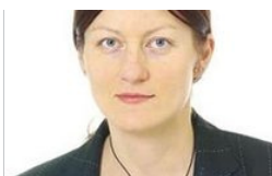
Lapsed vajavad hinge toitmist