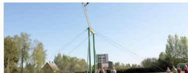
Noored kiikasad kiikudes üle Tsirguliina