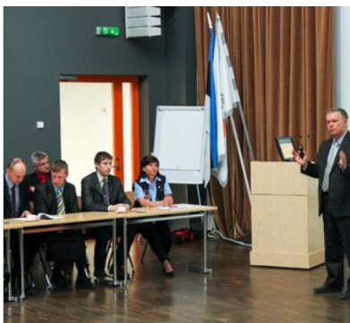
Maksuamet tugevdab võitlust petturitega